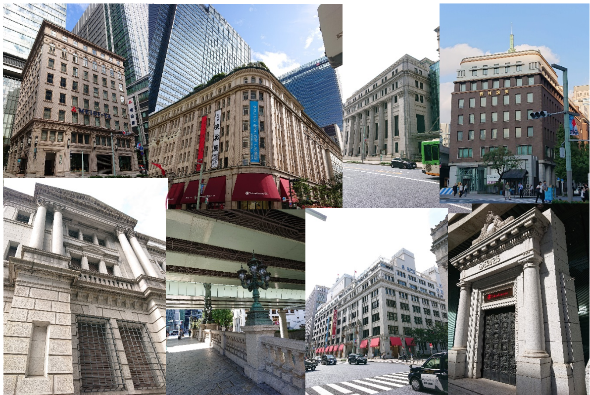
Bプラン：2019年11月23日（土）京橋-日本橋コース